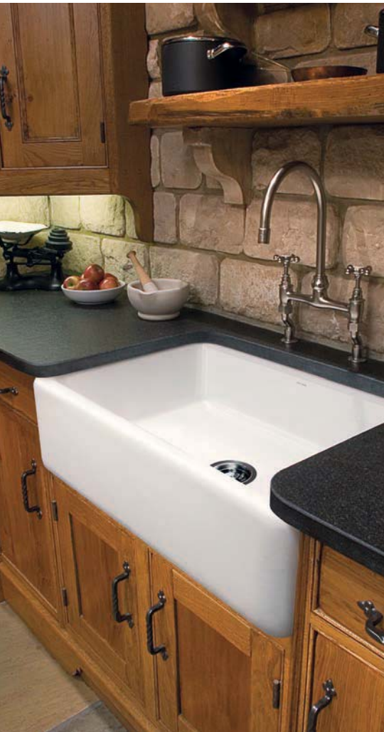
080001 · Cambridge Large (White)