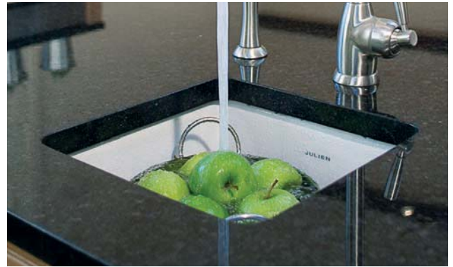
085101 · Nantucket Small (White)